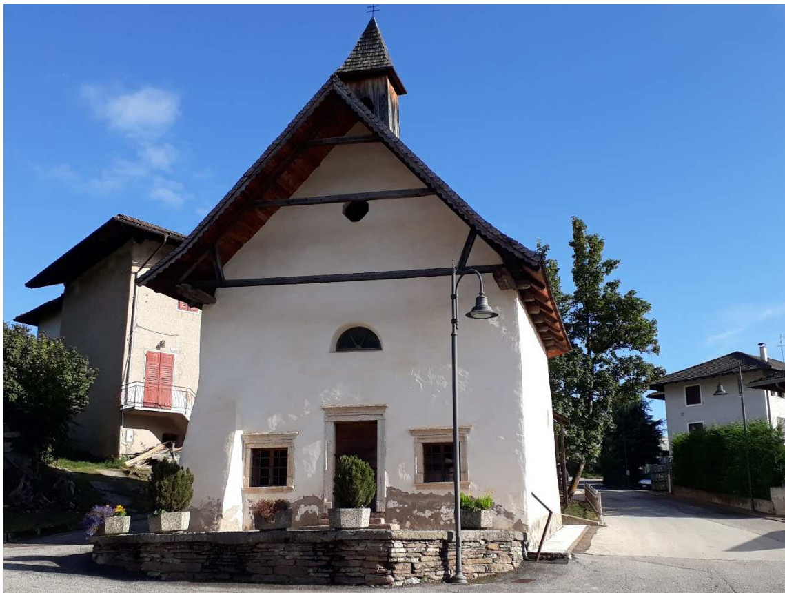
Vista da nord